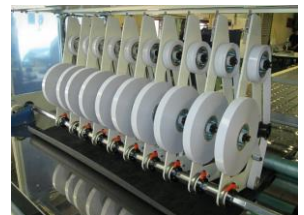
テープ貼合せユニット