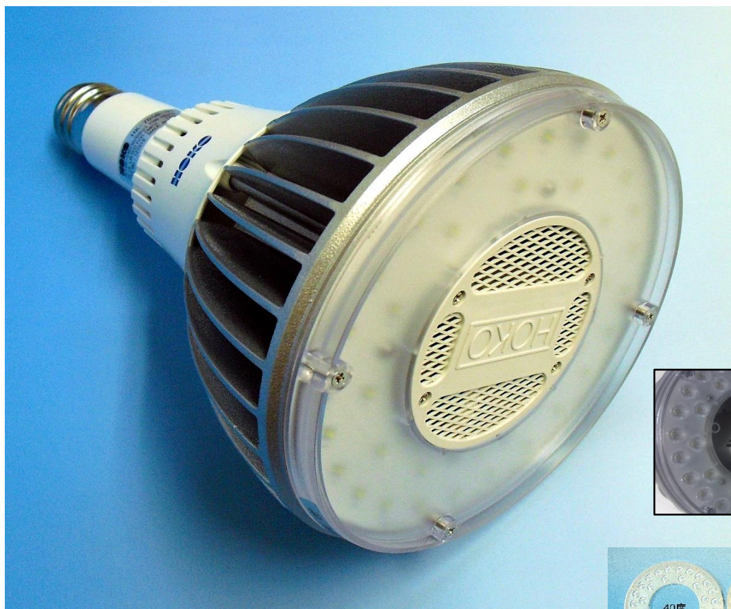
カセット式安定器内蔵